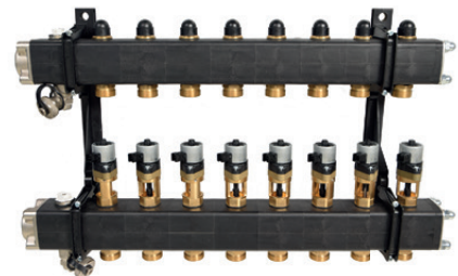
Autotemp Spider verdeler/verzamelaar