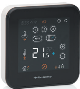
Spider WP Thermostaat